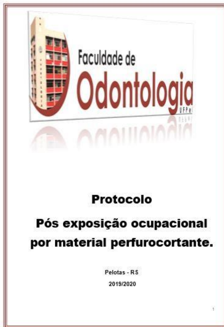
Figura 1: Capa do Manual de condutas e orientações pós exposição ocupacional por material perfurocortante da Faculdade de odontologia da UFPEL/RS.