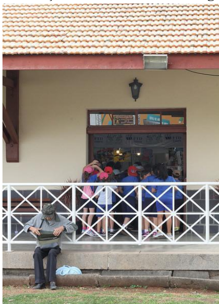
Figura 5: “Estação literatura”