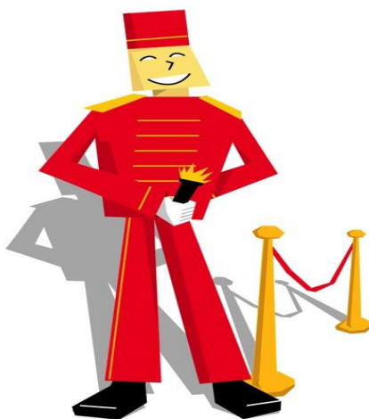
Imagem 02 – O lanterninha