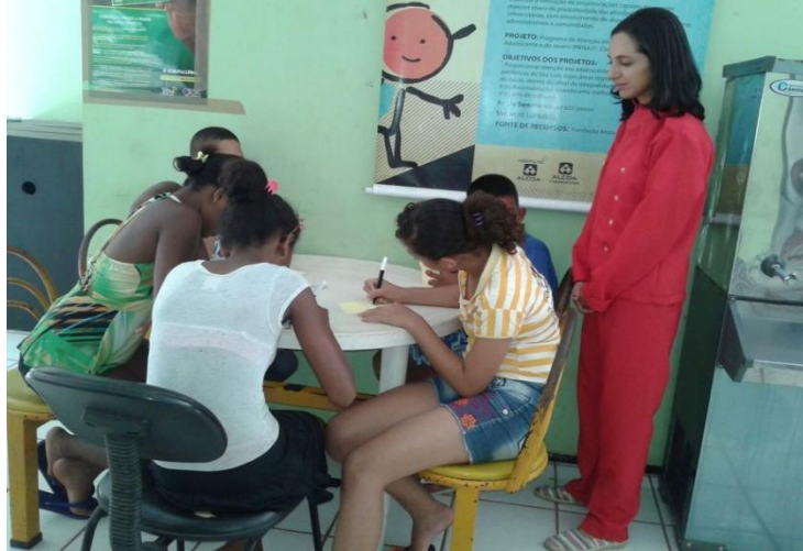
Imagem 09 – Participação da comunidade nas oficinas

introdução à linguagem do audiovisual. Do processo resultaram algumas produções que foram registradas em celulares. As imagens 09 e 10 mostram o momento de realização das oficinas.