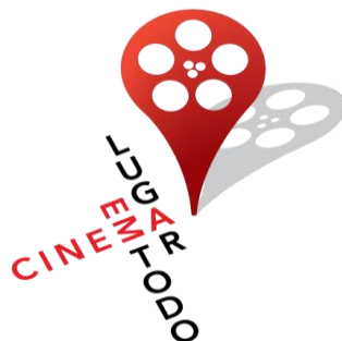
Imagem 01 - Logotipo do Projeto