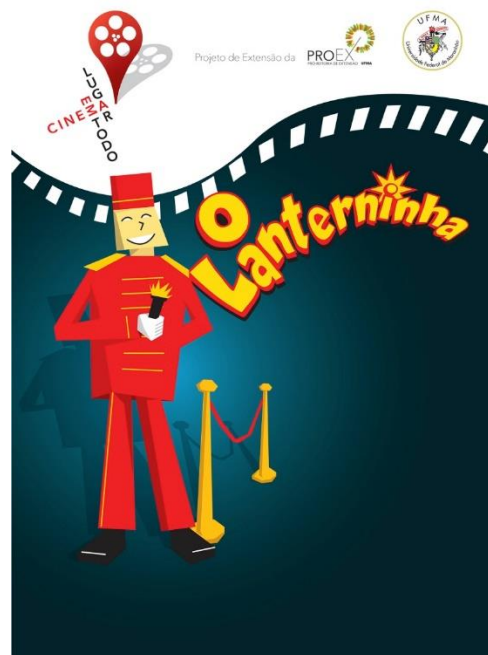
Imagem 08 - Capa do Folder Roteiro de Apreciação para os professores