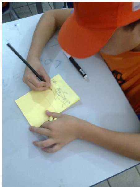
Imagem 04 – Aluno do Ensino Infantil produzindo sua animação utilizando técnica do flipbook