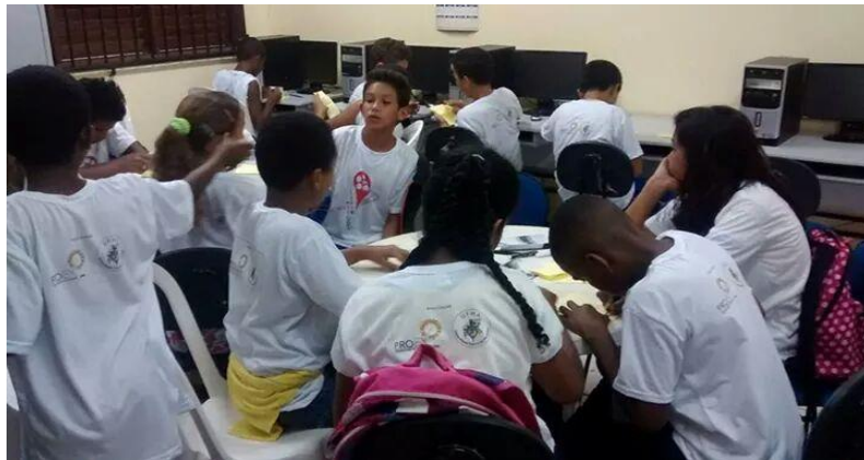
Imagem 10 – Mostra Jovem com alunos do Ensino Fundamental nas oficinas