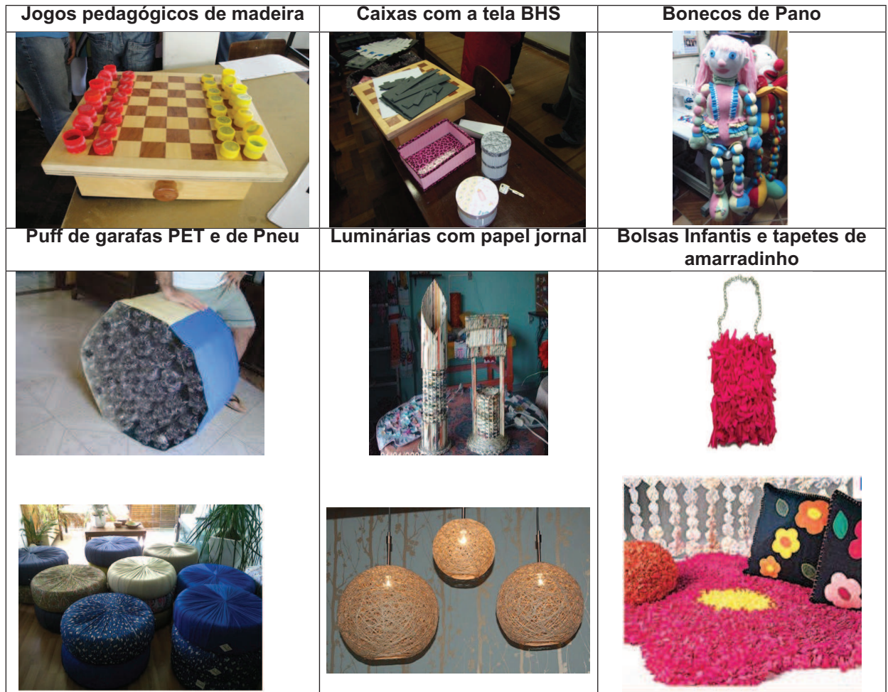
FIGURA 2: PRODUTOS EM FASE DE DESENVOLVIMENTO PELO PROJETO PRODUÇÃO EM FOCO

Até o presente momento, o projeto está de acordo com o planejamento desenvolvido e conta com a participação de oito alunos de graduação da UFPR (7 da Engenharia de Produção e 1 do Design de Produtos), um aluno de mestrado em Engenharia de Produção e três professores da UFPR.