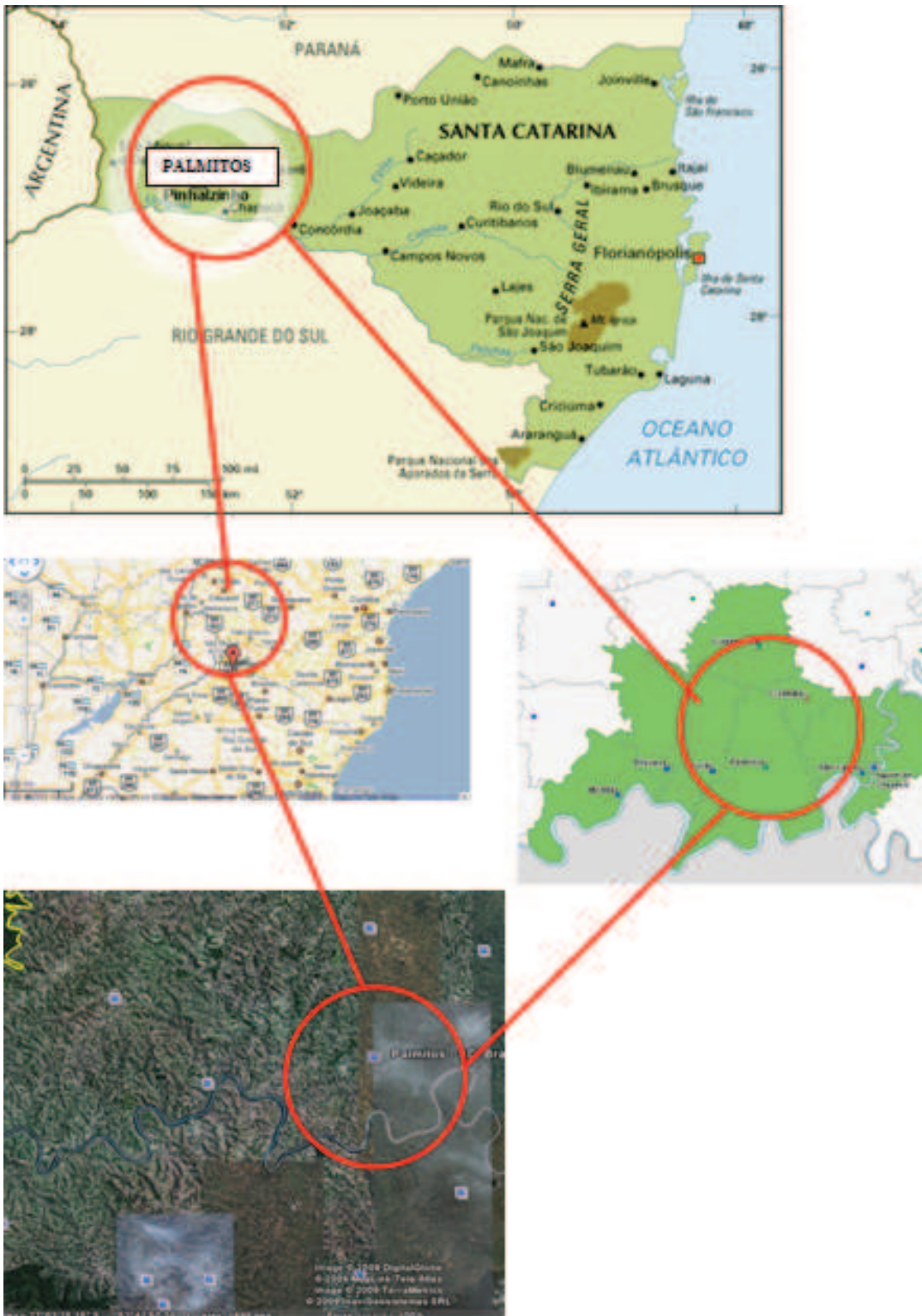
FIGURA 1 - LOCALIZAÇÃO DO MUNICÍPIO DE PALMITOS

perfeita. É calculado a partir da renda sendo a razão do montante dos 40% mais pobres e dos 10% mais ricos (2007).