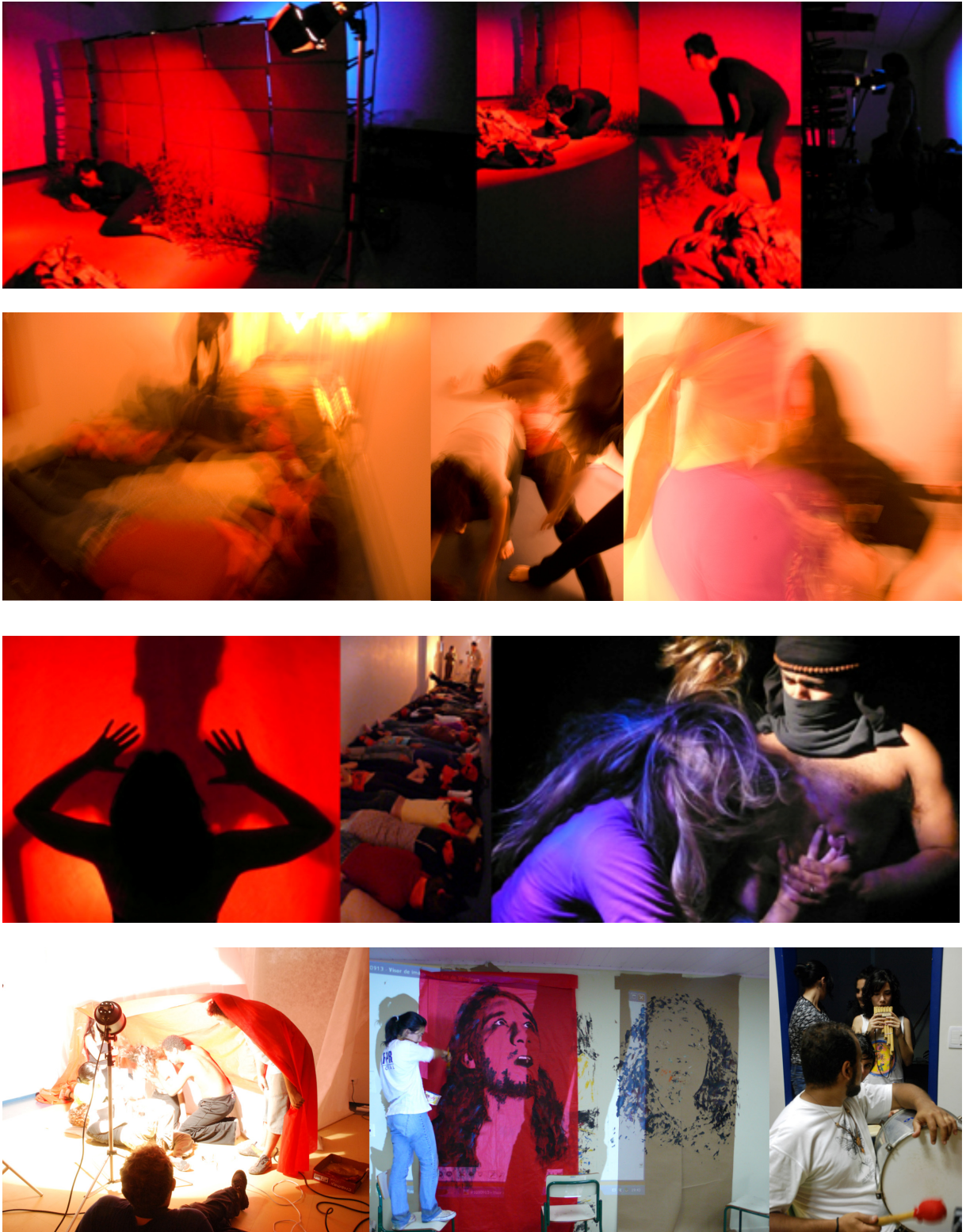
Imágenes de acciones y procesos de creación artística. Fisuras e Hibridaciones. Octubre y noviembre de 2008 en la UFPR - Litoral.