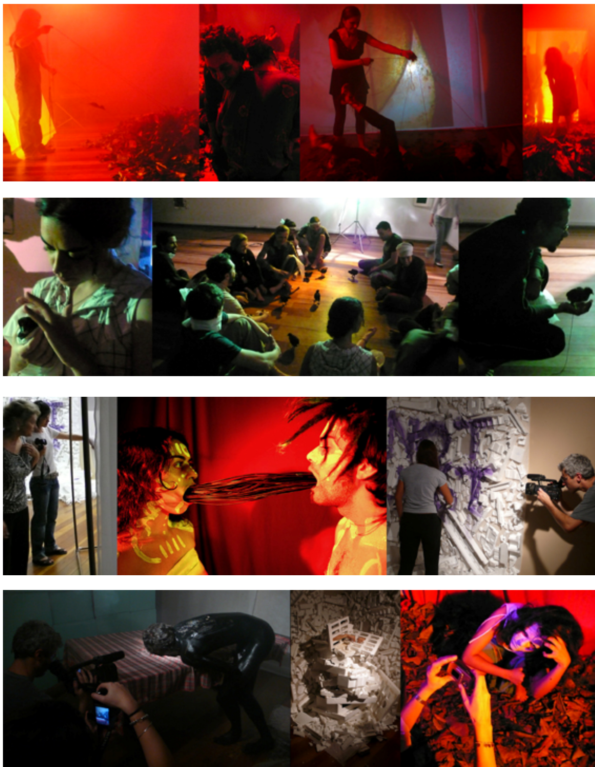
Imágenes de acciones y procesos de creación artística. Fisuras e Hibridaciones, octubre y noviembre de 2008 en el Departamento de Música y Artes de la UFPR.