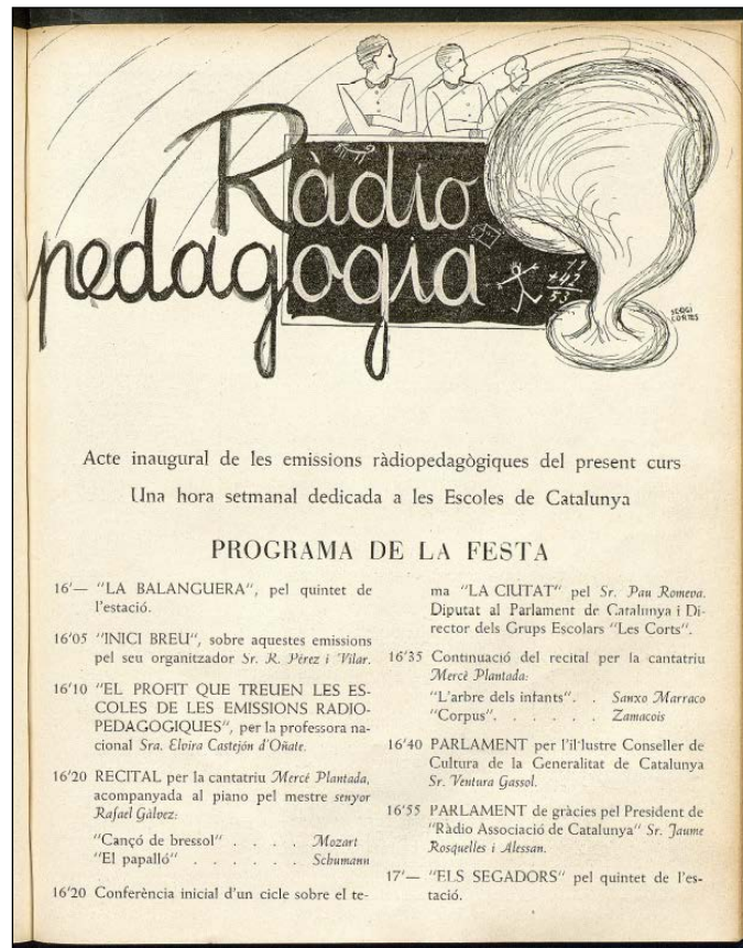
Figura 1: Catalunya Ràdio, Núm. 79 - 4 de noviembre de 1933, 25