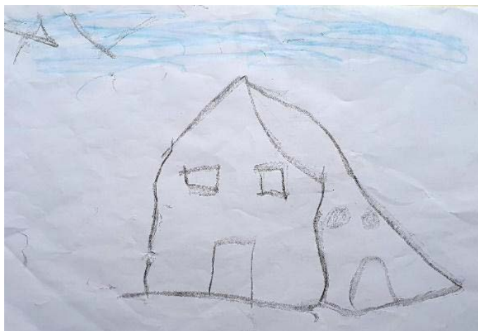
Imagem 5: Desenho criado por Pamela