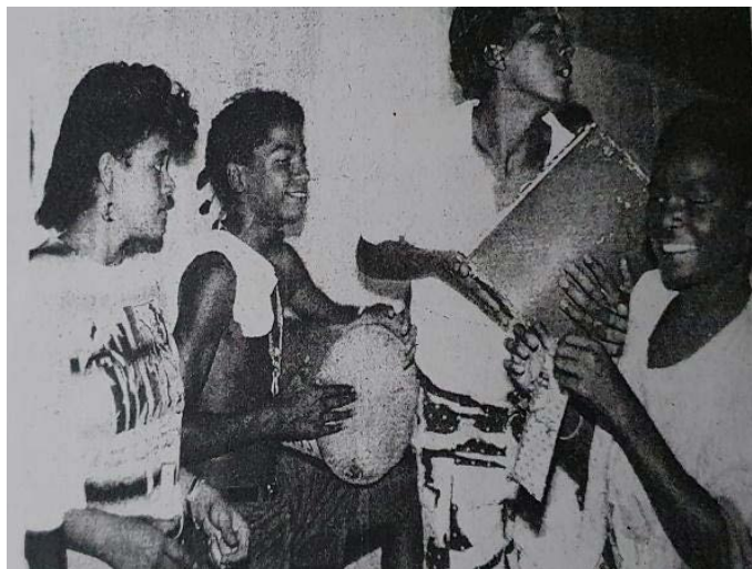
Imagem 1: Alunos na Escola de Educação Juvenil Tia Ciata-Rio de Janeiro