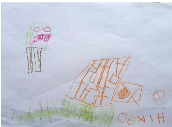
Imagem 3: Desenho de uma moradia.

Em 2022, realizamos uma ocupação em uma praça pública de aproximação e diálogo com algumas dessas famílias vulnerabilizadas. Em sua maioria, eram ex-moradores da ocupação do “Prédio da Caixa”, localizado no centro da cidade, despejados em junho de 2019, que migraram para as comunidades ao entorno do centro da cidade ou foram para a Instituição de Acolhimento Familiar na mesma região. Participaram desse encontro muitos trabalhadores e trabalhadoras do setor público da Saúde Mental, Assistência Social e Economia Solidária e Cultura, além de professores, estudantes e extensionistas da UFF. Nesse encontro, que contou com a presença de mais de cinquenta crianças, levamos papel, canetas, giz de cera e outros materiais. Desenhamos juntos e as crianças produziram desenhos que representavam onde moravam. Colocamos abaixo três produções desses desenhos de crianças de seis a 12 anos que brincaram durante o encontro na praça.