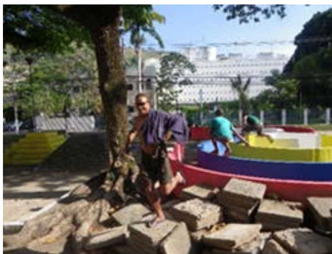
Imagem 2: Crianças e adolescentes brincando de caça ao tesouro na Praça Vital Brazil, Niterói-RJ, 2018.

Durante as brincadeiras ou oficinas propostas em encontros articulados entre os e as trabalhadoras da Rede de Atenção Psicossocial (RAPS), com o apoio do projeto de extensão vinculado à Universidade Federal Fluminense (UFF), territorialmente foram realizadas em praças públicas da cidade (antes sem vida, sem movimento, e agora ocupada) com bebês, crianças, jovens e adultos, território existencial destes. Muitas reinventaram as brincadeiras, criavam formas de brincar e chamavam o público adulto que ali estava para mostrar e exibir outras tonalidades corporais, um contraponto à fábula do garoto cinza, desbotado e sem vida presente na pesquisa de Baptista (2001), que pode representar, em certo ponto, esse cotidiano vivido. Estas são pequenas demonstrações de seu comportamento guerrilheiro de vivência (na rua) e em relação à cidade como lugar de coexistência (Gobbi, 2019).