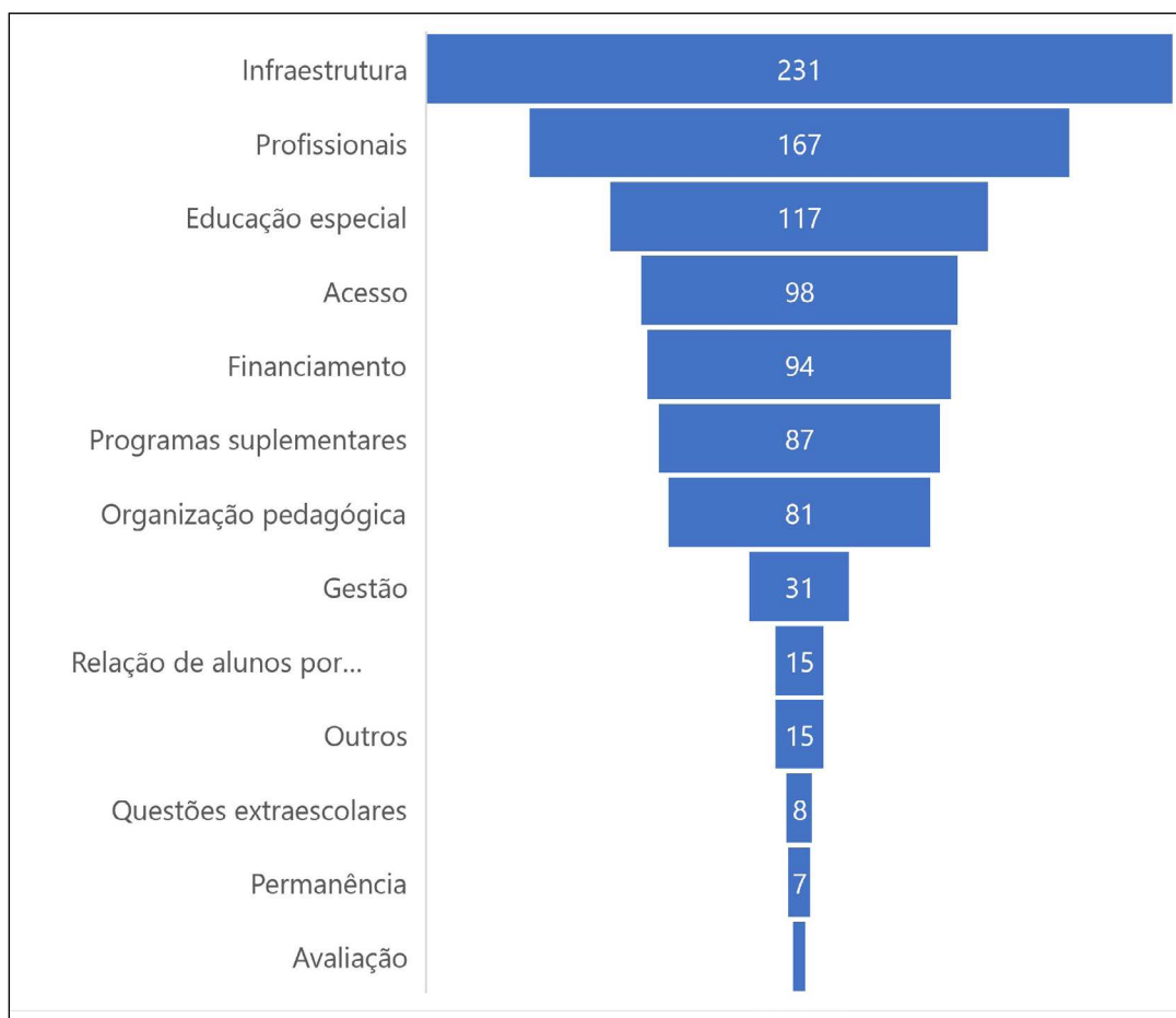
Gráfico 1: Procedimentos sobre qualidade da Educação Básica do Ministério Público de nove estados (MPAL, MPAP, MPBA, MPES, MPMA, MPPB, MPRN, MPRO E MPRS) organizados por temas.