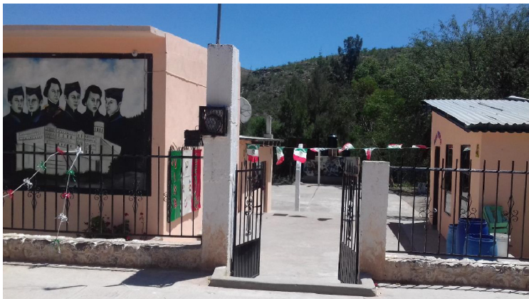
ILUSTRACIÓN 3 - escuela primaria rural multigrado “Niños Héroeos”.