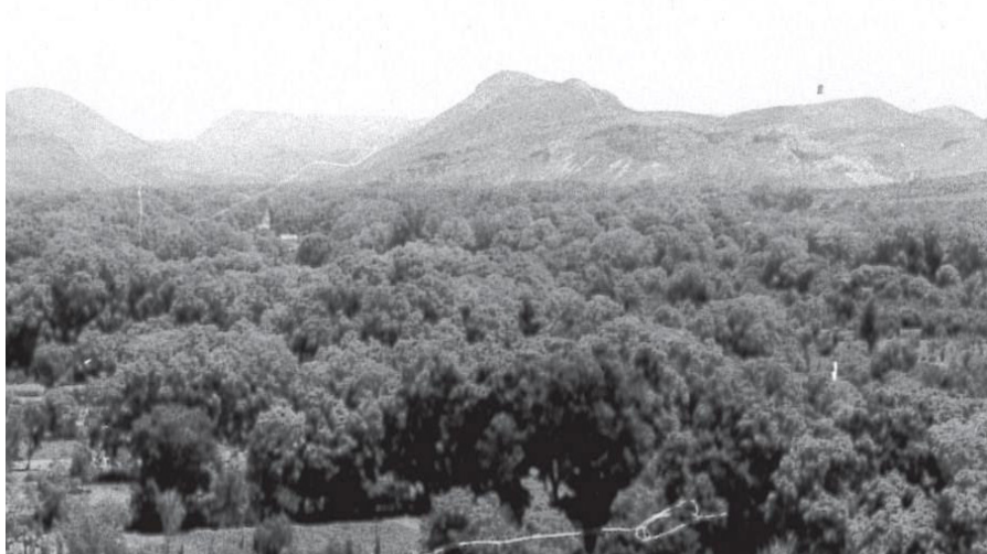
ILUSTRACIÓN 1 - Montañas y nogales de Santa María del Río: