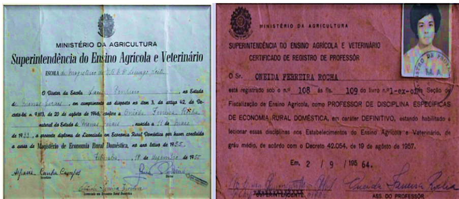
FIGURA 1 – Diploma de Magisterio de Economía Rural Doméstica

aprecia la copia del diploma de una de las primeras alumnas del Curso de Magisterio en Economía Rural Doméstica y la matrícula de Docente de Asignaturas Específicas en Economía Rural Doméstica otorgada por la Superintendencia de Educación Agropecuaria y Veterinaria del Ministerio de Agricultura, cuya titulación permitió impartir estas materias en establecimientos rurales o en la educación secundaria agrícola y veterinaria.