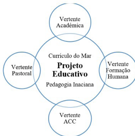
FIGURA 1 – VERTENTES DO PROJETO EDUCATIVO

De acordo com a recolha e análise documental, e no que concerne ao projeto educativo da escola onde foi desenvolvida a investigação, foi possível verificar que este se constrói a partir de 4 pilares – a vertente académica, a formação humana, pastoral e atividades de complemento curricular (ACC) –, assente na procura de exercício de uma pedagogia em específico – a pedagogia inaciana, visto ter como patrono um antigo Superior-Geral da Companhia de Jesus - e na construção interdisciplinar de um currículo do mar, conforme é possível constatar na Figura 1.