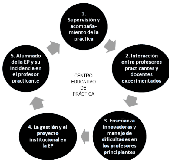
FIGURA 1 – DIMENSIONES DE ANÁLISIS DE CENTRO EDUCATIVO DE PRÁCTICA

Posteriormente al análisis estadísticos de las opiniones, nuestro interés fue profundizar sobre la experiencia observada, recuperando la voz y las valoraciones de los estudiantes, docentes e informantes calificados entrevistados. Se construyeron cinco dimensiones consideradas ejes principales del análisis cualitativo, tal como lo representa la Figura 1.