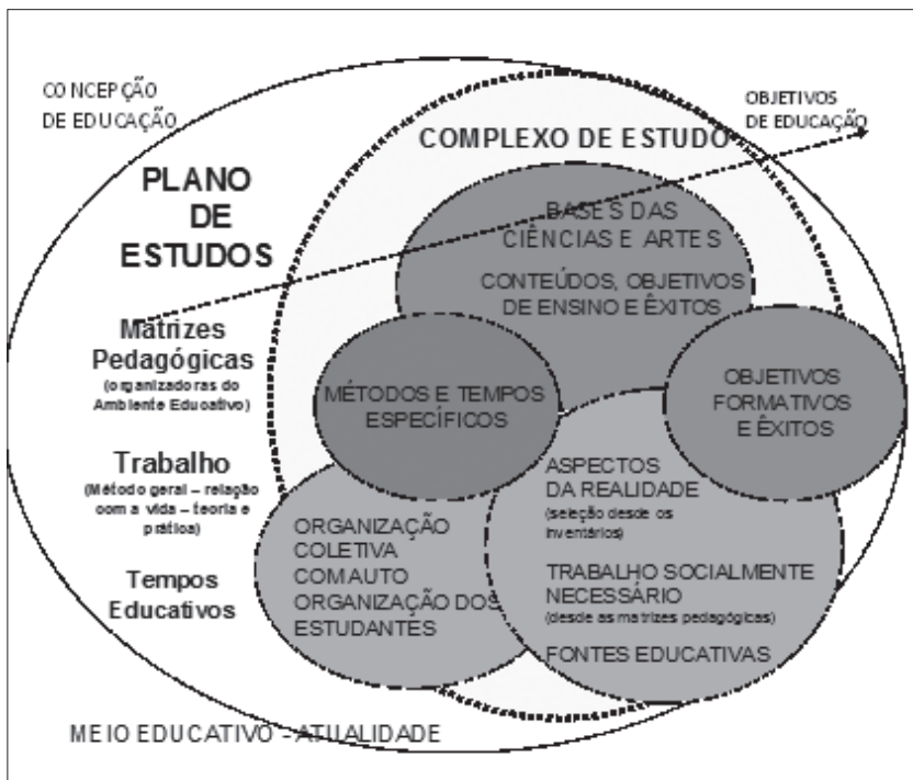
FIGURA 1 – ESQUEMA DA PROPOSTA DA UNIDADE COMPLEXO

FONTE: Freitas, Sapelli e Caldart (2013).