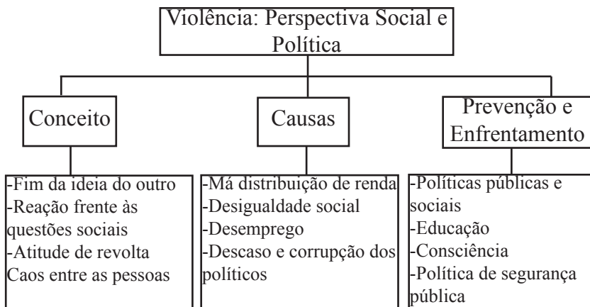
FIGURA 1 - CLASSE 1 - VIO-LÊNCIA/PERSPECTIVA SOCIAL E POLÍTICA

Conforme pode ser visualizado na figura1, a classe 1, denominada VIO-LÊNCIA: PERSPECTIVA SOCIAL E POLÍTICA é composta por três subclasses: conceito, causas e enfrentamento/prevenção.