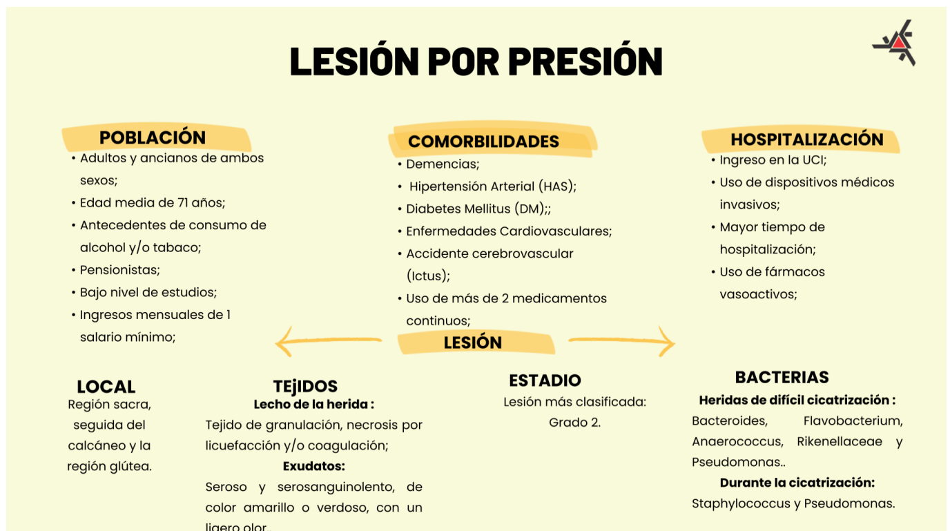
Figura 2 - Mapa conceptual del desarrollo de las lesiones por presión. Maringá, PR, Brasil, 2024 (n=29)