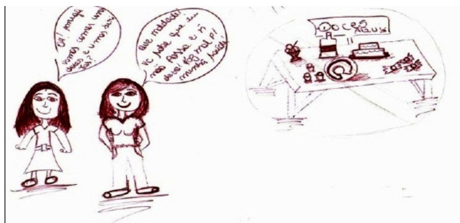
Figura 1 – Produção artística do Adolescente 8 referente ao conviver com as restrições impostas pela doença em um grupo de amigos. Chapecó, 2011

Minha alimentação é normal, só mais controlada [...]. Às vezes sinto falta de algumas coisas [...]. O que mais sinto falta é chocolate. (Adolescente 3)