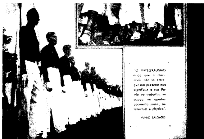
(ANAUÊ, n. VII de 10/05/1936).

convencimento inerente. Na revista Anauê se utilizavam as fotografias para atestar a realidade e concretude do movimento e comprovar como esse era genuinamente brasileiro – isso se fazia principalmente através das imagens de comícios e marchas nas mais diversas cidades brasileiras (BULHÕES, 2007, p. 55). Pode-se notar também que o uso das fotografias na revista vai se aprimorando tecnicamente ao longo dos anos de sua existência, já que a disposição das fotografias na revista se modifica ao longo de suas edições. Como podemos notar por essa fotografia da Revista, em que mostra jovens enfileirados e ao lado uma citação de Plínio Salgado, como que para atestar a sincronia entre os militantes e o líder: