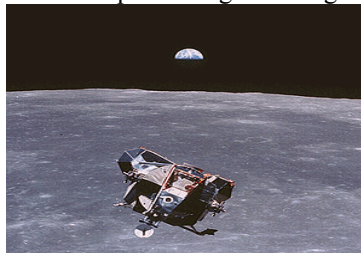
Figure 1 – Image of Apollo 11 lunar modulus.

Photographs – figures should be drawn on TIF or JPG format and numbered, there should always be a subtitle above them. The names – tables, figures and charts should be digitized in Times New Roman, font size 10 and there should be a period in the end of the text. There should not be any abbreviations for Tables, Figures and Charts, which should be numbered.