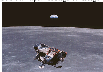
Figure 1 – Image of Apollo 11 lunar modulus.

Photographs – figures should be drawn on TIF or JPG format and numbered, there should always be a subtitle above them. The names – tables, figures and charts should be digitized in Times New Roman, font size 10 and there should be a period in the end of the text. There should not be any abbreviations for Tables, Figures and Charts, which should be numbered.