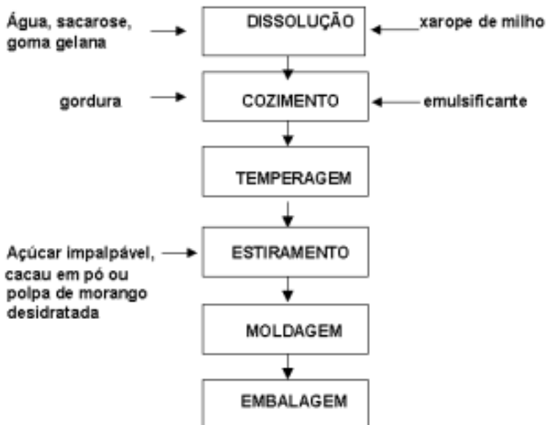
FIGURA 1 - FLUXOGRAMA GERAL DE PROCESSAMENTO DAS AMOSTRAS DE BALAS MOLES

As amostras também foram analisadas quanto ao teor de umidade pelo método de Karl Fisher (1).