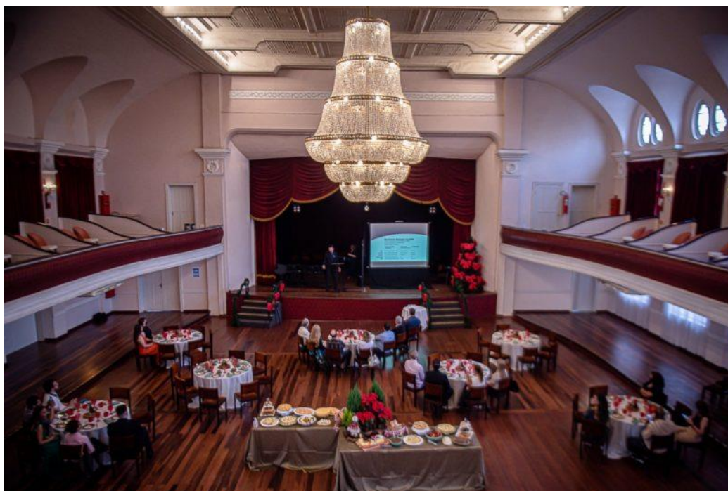
Figura 1. Sociedade Harmonia-Lyra

O primeiro Festival de Dança de Joinville foi realizado em 1983 na Sociedade Harmonia-Lyra. Trata-se da junção de duas associações fundadas por imigrantes alemães, dedicadas a promover a socialização por meio de bailes e diversas atividades artísticas, como teatro e música. A Sociedade Harmonia, a mais antiga que depois deu origem à Harmonia-Lyra, foi fundada em 1858, apenas sete anos após o início da colonização em Joinville, então ainda chamada de Colônia Dona Francisca. A sede em que ocorreu o primeiro Festival, contudo, foi construído já após a fusão com a Sociedade Musical, em 1930, e segue sendo usado para espetáculos e eventos. (Mickucz, 2017). Se compararmos com os grandes teatros de capitais e locais com uma colonização mais antiga, como o Theatro Municipal do Rio de Janeiro, por exemplo, se trata de uma estrutura simples, mas ainda assim com uma atmosfera de formalidade e elegância.