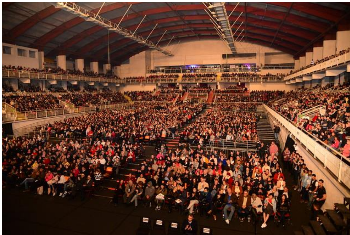
Figura 3. Centreventos Cau Hansen durante o 37º Festival de Dança de Joinville

O Centreventos resolveu todas as deficiências estruturais anteriores, inclusive com condições muito melhores que a grande maioria dos teatros renomados. Contudo, esteticamente, segue sendo um local simples, cuja proporção favorece as manifestações efusivas do público. Vale ressaltar que se trata de um espaço multiuso, que pode ser transformado em uma quadra esportiva. Assim, mesmo com a estrutura exemplar, tal mudança não afastou tanto o Festival de Dança de Joinville dessa atmosfera esportiva. O formato do Centreventos propicia inclusive que, nos intervalos entre as apresentações, os espectadores de um lado interajam com o outro lado mexendo as luzes de seus celulares, fazendo coreografias, e até mesmo fazendo uma ‘ola’ que percorre toda a arquibancada.