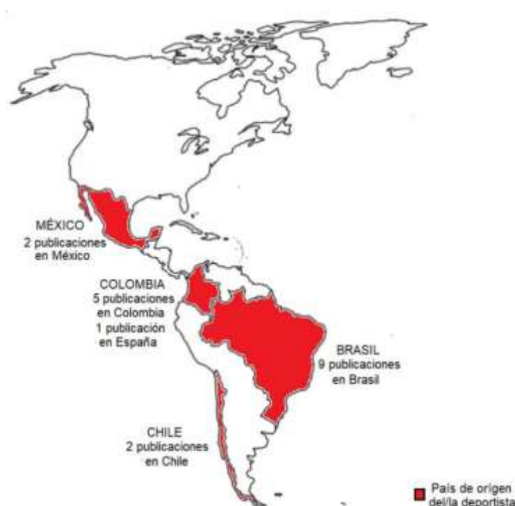
Figura 2. País de origen de deportistas y país de publicación del documento