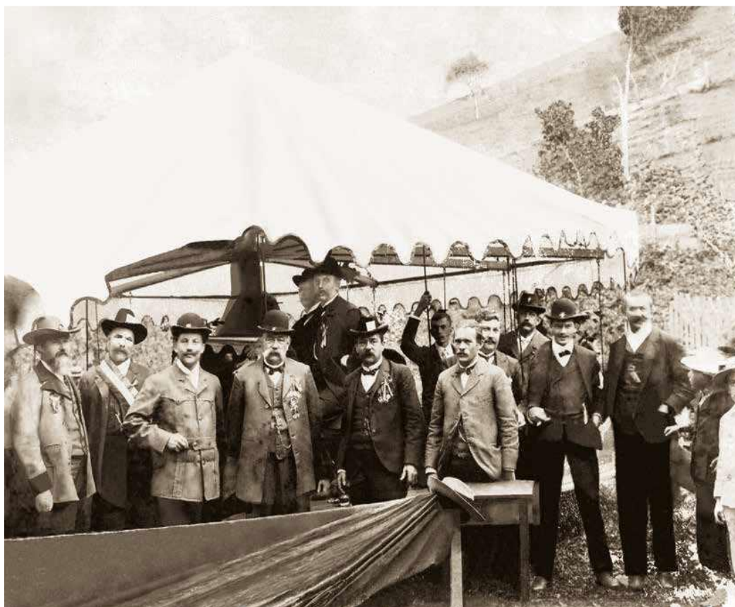
Figura 3 - Atiradores no interior da sociedade 1909