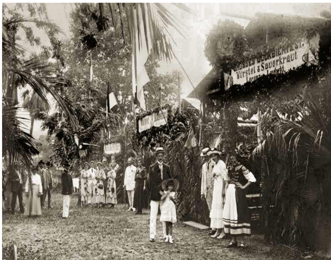
Figura 4 - Sócios em festividade no interior da Sociedade Atiradores 1910