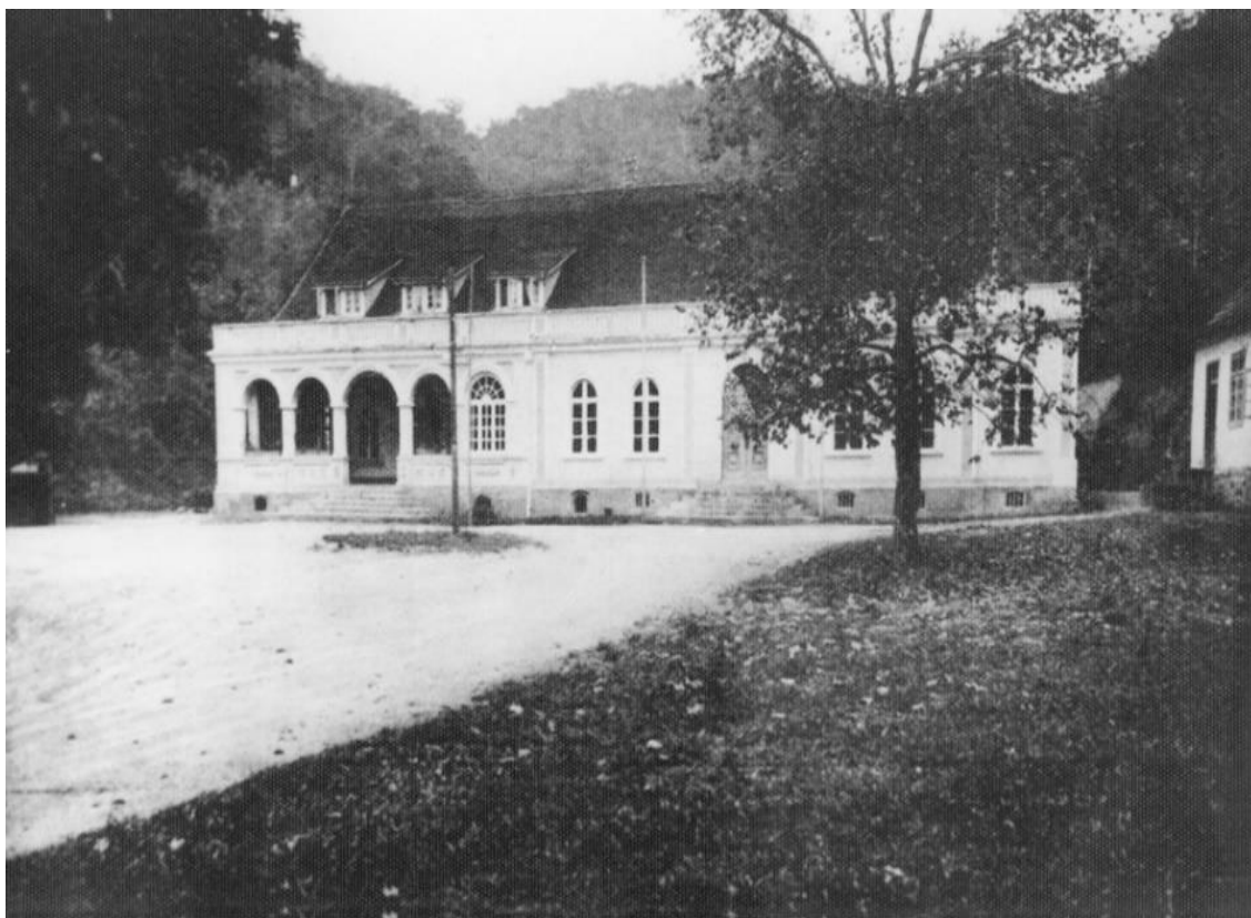
Figura 2 - Segunda sede da Schützenverein Blumenau