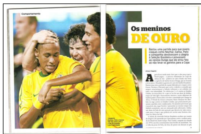
Figura 1: “Os meninos de ouro” – Revista Isto É

Na mesma lógica, a Revista Isto É (edição nº 2127, de 18/08/2010), traz a matéria realizada pelo jornalista Amauri Segalla, intitulada “Os meninos de ouro”, destacando o resgate do “jogo bonito” por meio do futebol apresentado pelos jovens craques Pato, Neymar e Ganso na seleção brasileira renovada.