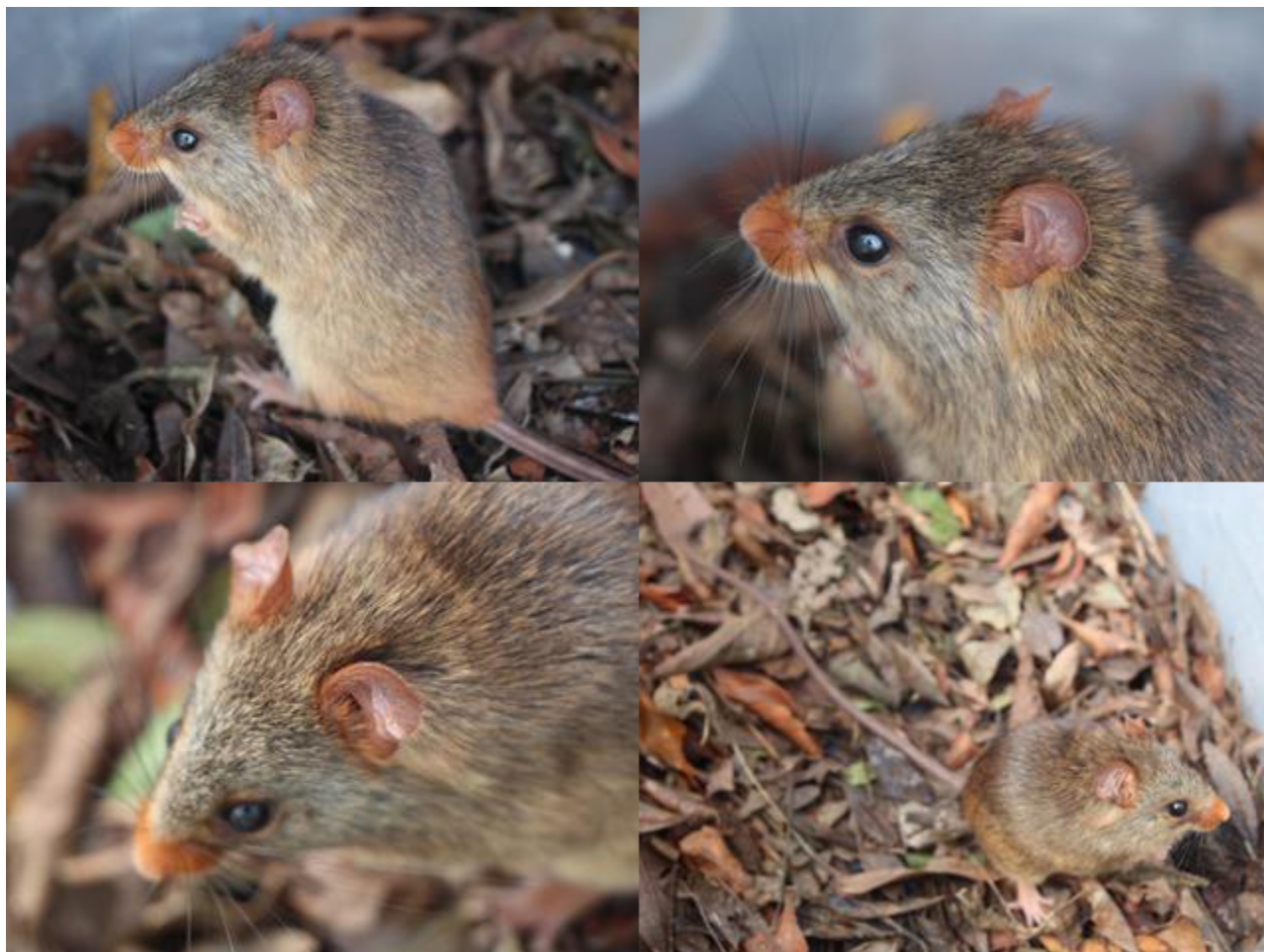
Figura 3. Wilfredomys oenax , PCH Lucia Cherobim, Porto Amazonas, Paraná, Brasil.

Juscelinomys candango e Gyldenstolpia planaltensis . Bezerra (2011) discutiu de forma consistente o estado populacional dessas duas espécies com base em esforços de campo significativos realizados desde o início da década de 1990 e nas poucas listas de espécies ameaçadas onde W. oenax é citada (Mikich & Bérnils, 2004; Bressan et al., 2009). Estas novas observações da espécie de característica eminentemente elusiva e inconspícua é de relevância para o entendimento da sua distribuição geográfica, instituindo a possibilidade de ampliação do conhecimento da história natural e, conseqüentemente, contribuindo para a conservação do táxon.