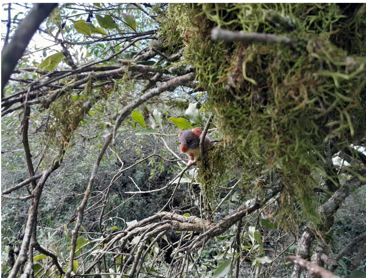
Figura 1. Wilfredomys oenax , fazenda Capão Alto, rio Taquara, município de Castro, Paraná, Brasil.

Os novos registros aqui apresentados foram obtidos em condições distintas das anteriores, como será descrito e comentado, a seguir: