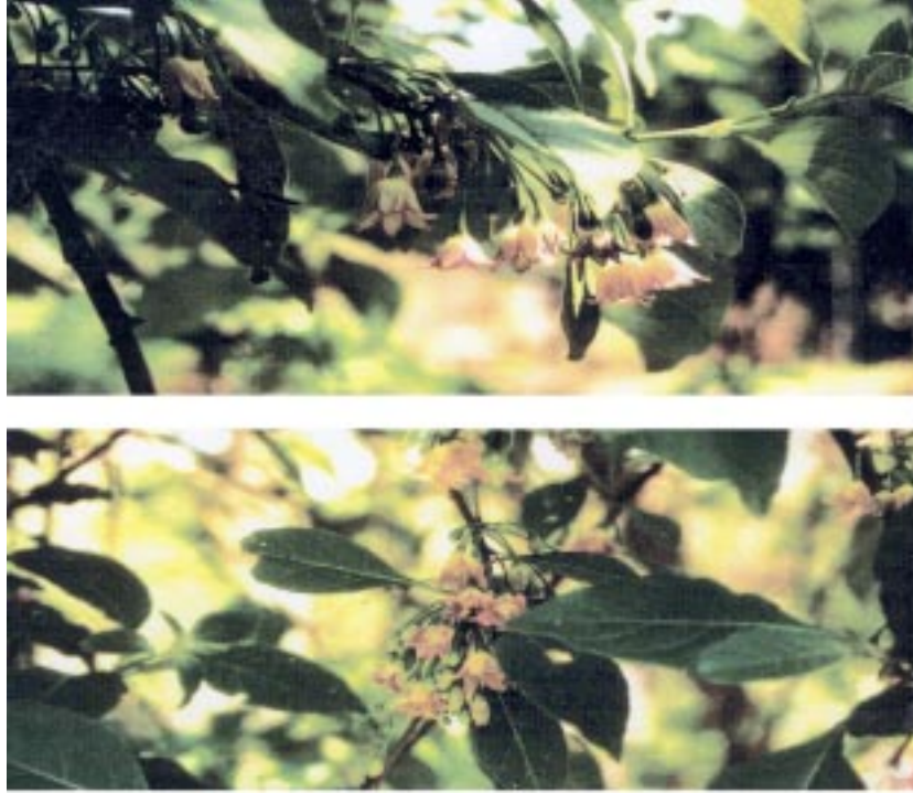
Fig. 2. Ramos com flores de Vassobia breviflora (Solanaceae).

Nota-se, portanto, que o período de atividade de vôo de Bicolletes tauraphilus para a obtenção de alimentos (néctar e pólen), coincide com o período de floração de V. breviflora , que ocorre entre setembro e novembro.