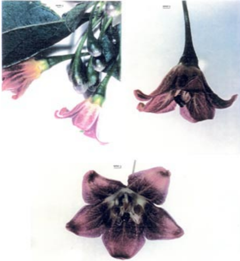
Fig. 1. Flor de Vassobia breviflora (Solanaceae).

No levantamento realizado em PP-92/93, isto é, no Passeio Público em 1992/93 (TAURA & LAROCA, 2001), observa-se a captura de Bicolletes tauraphilus , somente nas flores de V. breviflora .