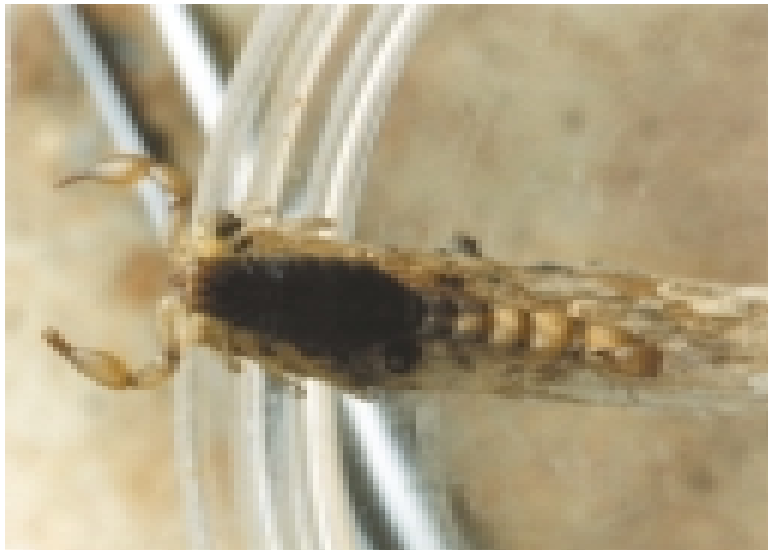
Fig. 8. Bothriurus rochai (forme typique). Exempleire femelle collectée à Ipanguaçu dans l'Etat de Rio Grande do Norte.