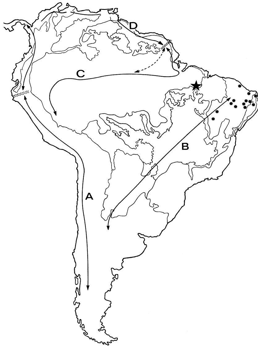
Fig. 1. Carte des principaux domaines morphoclimatiques de l'Amérique du Sud, avec indication des stations connues pour la forme typique de B. rochai , (astérisques noirs) et pour la nouvelle sous-espèce B. r. occidentalis (étoile noire).