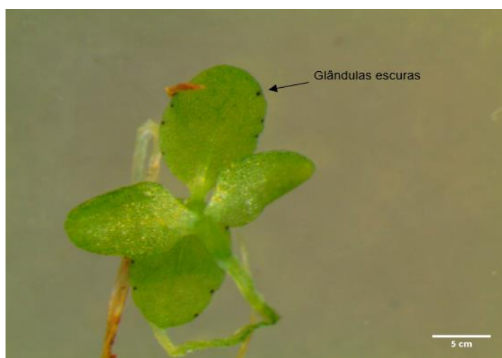
Figura 2 - Glândulas escuras presentes na face dorsal do primeiro par de folhas em Hypericum perforatum .

A hipericina e pseudo-hipericina são encontradas nas glândulas escuras, que são pequenas pontuações pretas que se estendem em todas as partes aéreas da planta, ocorrendo nas folhas desde as primeiras fases do crescimento (Figura 2). Durante o período de floração, as glândulas escuras expandem-se a quase todas as partes da flor (FORNASIERO et al., 1998; KOSUTH et al., 2003).