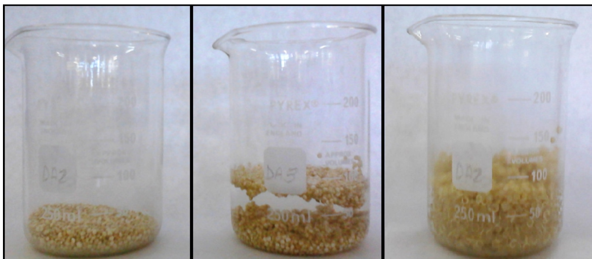
FIGURA 1: Etapas da hidratação de grãos da quinoa

Na imagem acima mostra as etapas da hidratação da quinoa à quente, no ultimo quadro já cozida a quinoa as fibras ficam bem evidentes